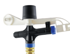
Arroseurs à Impact

Débits : 425 - 8177 l/hr (1,87 - 36,0 gpm) Pressions : 2,07 - 4,14 bar (30 - 60 psi)