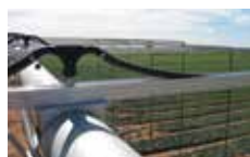
Système De Perche À Pivot

Pour les pivots centraux et les portes à faux