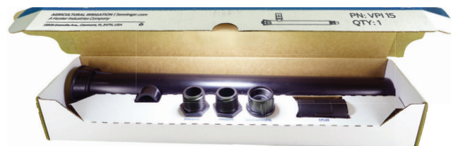
Mostrado acima: Componentes por caixa.